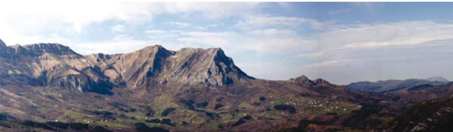
Fig 1. Sierra de Aralar. Vista panorámica de Las Malloas.

La cueva de Mendukilo se encuentra a 750 m de altura en tierras comunales del Concejo de Astitz. Ubicada en las faldas de la Sierra de Aralar, en el valle de Larraun, ha sido utilizada por los pastores desde tiempos inmemoriales. La gran boca que presenta orientada al norte con una primera sala fácilmente accesible, voluminosa y bien iluminada por la luz natural que recibe, la hace propicia como resguardo de montaña. Según nos demuestra el pequeño yacimiento arqueológico hallado en la sala de entrada (Artzainzulo), los pastores de la zona ya utilizaban esta sala desde la primera Edad del Hierro (800-300 a.C.).