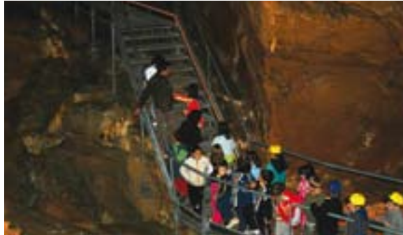
Fig. 11. Visita de los escolares en la cueva (sala laminosin)

programas pretenden inquietar la sensibilidad y la conciencia, ya que el conocimiento es la base del respeto. Las unidades didácticas están adaptadas al currículo escolar de cada nivel y pretenden ser un complemento práctico de lo desarrollado en las clases teóricas.