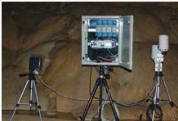
Fig. 9. Estación climática Laminosin 9. irudia. Laminosineko estazio klimatikoa