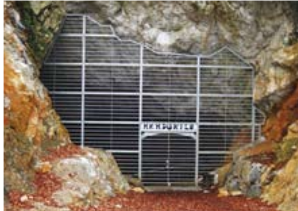
Fig. 5. Verja actual 5. irudia. Oraingo burdinsarea

Como las peticiones para acceder a la cueva eran numerosas, en 1996 el Ayuntamiento de Larraun a petición del Concejo de Astitz solicitó un anteproyecto para