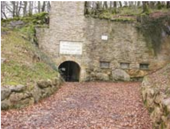
Fig. 4. Antiguo muro de protección 4. irudia. Babes hesi zaharra

la habilitación turística de la cavidad. Siguiendo esta línea, a finales del 2001 nació la empresa Cuevas de Astitz S.L. con la participación del Consortio Turístico Plazaola , los ayuntamientos de Lekunberri y Larraun y el Concejo de Astitz . Gracias a la ayuda de diferentes departamentos del Gobierno de Navarra, a principios del 2004 se iniciaron los trabajos para abrir la cueva al turismo el 22 de julio del 2005 (Fig.5).