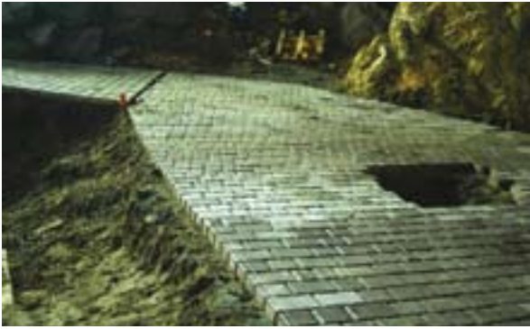
Fig. 7. Euroadoquin con todouno en Artzainzulo 7. irudia. Zagorra duen galtzada Artzainzulon

tían. El parking, con capacidad para 40 vehículos y 3 autobuses, se ubica 200 m por debajo de la boca de la cueva, evitando que algún vertido pueda afectar a la cavidad. El parking y la senda hacia la boca, están acondicionados con todouno permeable. Un tercio del parking está asfaltado para los autobuses.