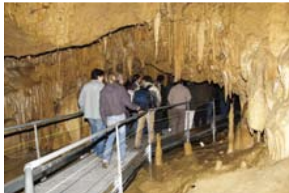
Fig. 8. Pasarela flotante metálica 8. irudia. Pasabide flotakor metalikoa

La rampa de bajada de la primera sala se ha acondicionado con todouno cubierto de euroadoquin y confinado con una banda de hormigón (para evitar su movimiento) (Fig.7). Esta disposición posibilita la filtración del agua por su camino original permitiendo el crecimiento de las concreciones de las salas inferiores. Las salas interiores se han habilitado con una pasarela flotante, metálica, galvanizada y desmontable (Fig. 8).