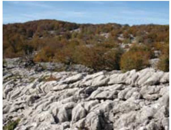
Fig. 2. Aspecto del exokarst de Aralar en las zonas altas de la Sierra 2. irudia. Aralarko exokarst-aren itxura mendilerroko goiko aldeetan

Los pastores han utilizado los recursos naturales que han encontrado en su entorno porque eran su única