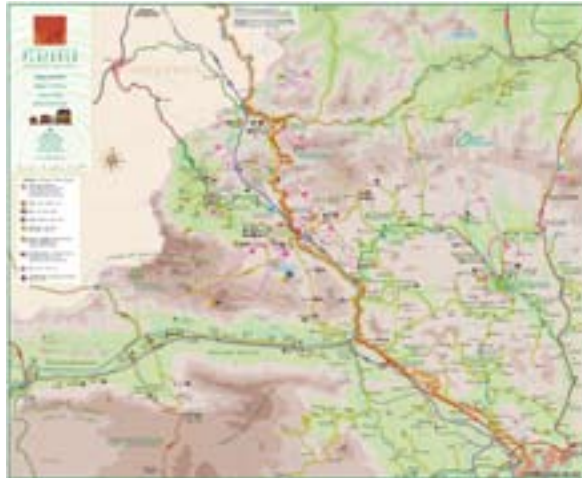
Fig. 3. Mapa del ámbito de actuación del Consorcio Turístico Plazaola 3. irudia. Egungo Plazaolako Patzuergo Turistikoaren jarduera eremuaren mapa

En 1902 se otorga a la Compañía Minera la autorización para la construcción y explotación de un ferrocarril para transportar hierro extraído de las minas de Plazaola hasta la estación de Andoain . En 1904 el ferrocarril Andoain-Plazaola fue autorizado para el transporte de viajeros y en 1914 se inauguró la línea que unía Pamplona-Lasarte (84,2km). Las estaciones de Leitza y Lekunberri tuvieron gran importancia en la línea. Transcurridos los años, en 1953 el servicio ferroviario queda suspendido por los desperfectos provocados por las riadas. A partir de 1989 se realizan los primeros estudios de viabilidad para recuperar el trazado del Plazaola como Vía Verde y en 1994 se constituye el Consorcio Turístico Plazaola para llevar adelante este proyecto. En 1998 se inaugura la rehabilitada Estación del Plazaola de Lekunberri y se instala en ella la oficina de turismo y la sede del Consorcio Turístico (Plazaola nº13, 2006). Así mismo comienzan las obras de recuperación del recorrido Plazaola entre Lekunberri