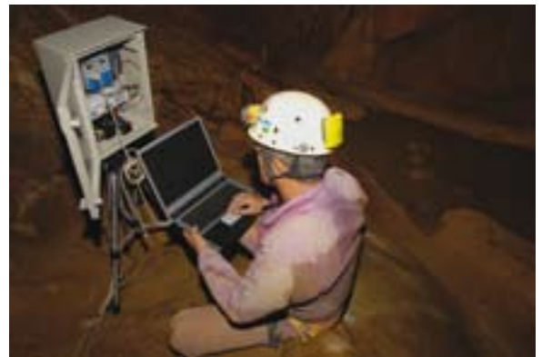
Fig. 10. Extracción de datos de los dataloggers 10. irudia. Datu estrakzioa

Leizea irekiz geroztik (2005eko uztailaren 22an), egiten diren bisita guztiak gidatuak dira. Bisitarien hasierako kopuruak finkatzeko, leizearen bolumena hartu zen kontuan eta arduraz jokatzearen printzipioari jarraitu zitzaion; gehienez ere 375 pertsona egunean finkatu zen goi denboraldian, 15 sarrera eginez 25 pertsonako taldetan. Bi urtez (2006-2007) azterketa klimatikoa egin ondoren, datu positiboak jasota eta bisitarien ohiturak kontuan hartuta, plataformak eta ibilbidea zabaldu ziren Herensugearen Gotorlekuan, 50 pertsonako taldeak jaso ahal izateko (2008ko urtarrila). Aldaketa horiek baliabide moldakorragoa eta merkatuaren eskaerari erantzun diezaiokena edukitzea ekarri du berekin. Gaur egun 8 sarrera egiten dira egunean goi denboraldian, gehienez ere 50 pertsonako taldeekin (egunean 400 pertsona). Bisitak ordu bete irauten du, 40 metrotaraino jaisten da eta hiru gela bisitatzen dira 540 m-ko ibilbidean. Orain arte, ez da inoiz gainditu egunean 350 bisitarien kopurua.