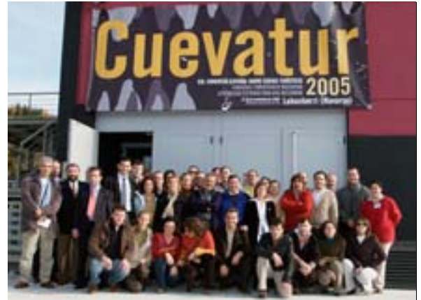
Fig. 12. Miembros de la ACTE, del Comité Organizador y algunos participantes en El 1er Congreso Español sobre Cuevas Turísticas celebrado en Lekunberri 12. irudia.ACTEko kideak, Batzorde Antolatzailekoak eta partaide batzuk, Lekunberri burututako Leize Turistikoei buruzko Espainiako 1. Kongresuan.

Cuevas de Astitz S.L. colaboró con el Comité Organizador y presento una ponencia en el congreso que aglutinaba todos los trabajos realizados en la